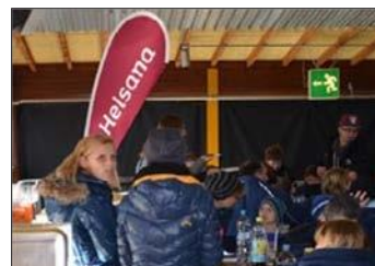
Logo-Präsenz im Stadion