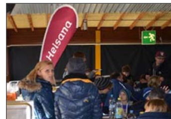
Logo-Präsenz im Stadion