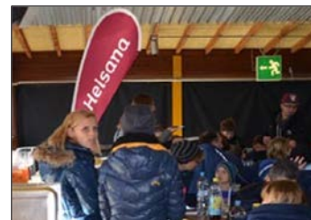
Logo-Präsenz im Stadion